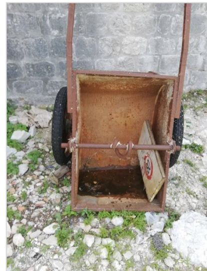
Ston 12.6.2019. – tačke, nalazište ličink

Popis vrsta i lokacija na kojima su provedena terenska istraživanja komaraca tijekom Treće odine