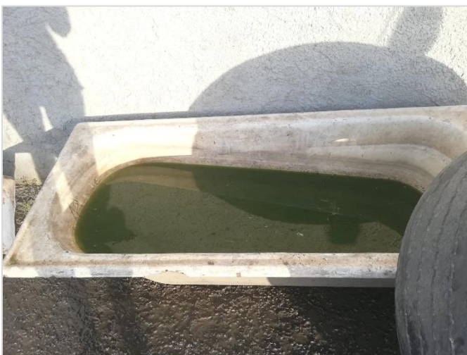
Hrvace 13.6.2019. – kada puna ličinki