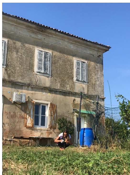
Grožnjan, bure – 30.7.2019., sakupljanje ličinki