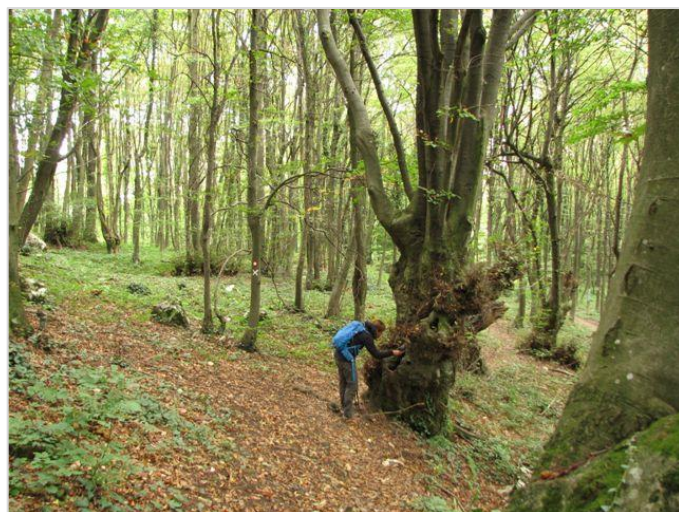
Uzorkovanje na Ravnoj Gori.