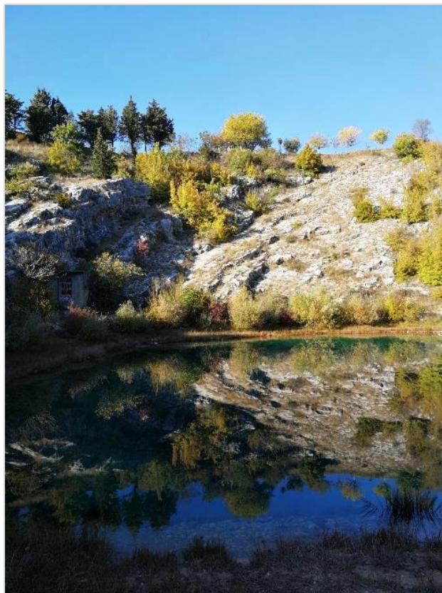
Glavašev izvor Cetine (uzorkovano područje)