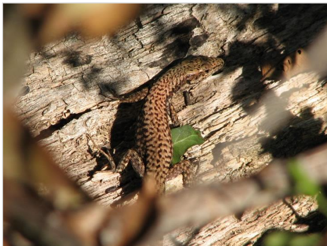
Zidna gušterica ( Podarcis muralis )