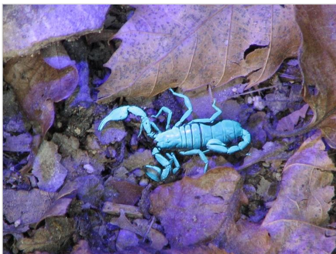
Štipavac ( Euscorpium sp.) pod UV svjetlom.