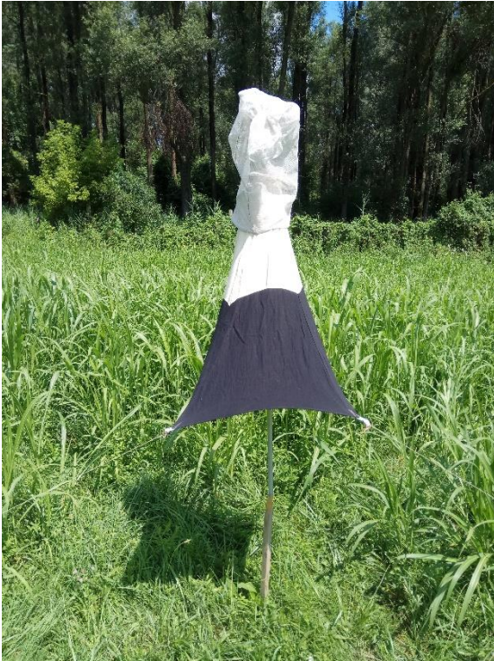
b) Modificirana mala Manitoba klopka (tzv. modified small canopy trap)