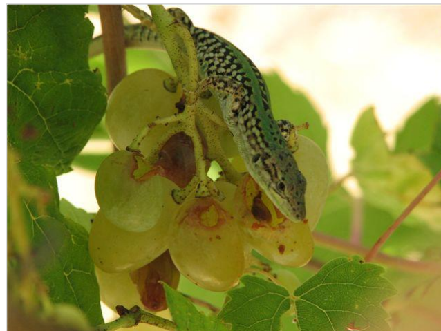
Primorska gušterica ( Podarcis siculus )