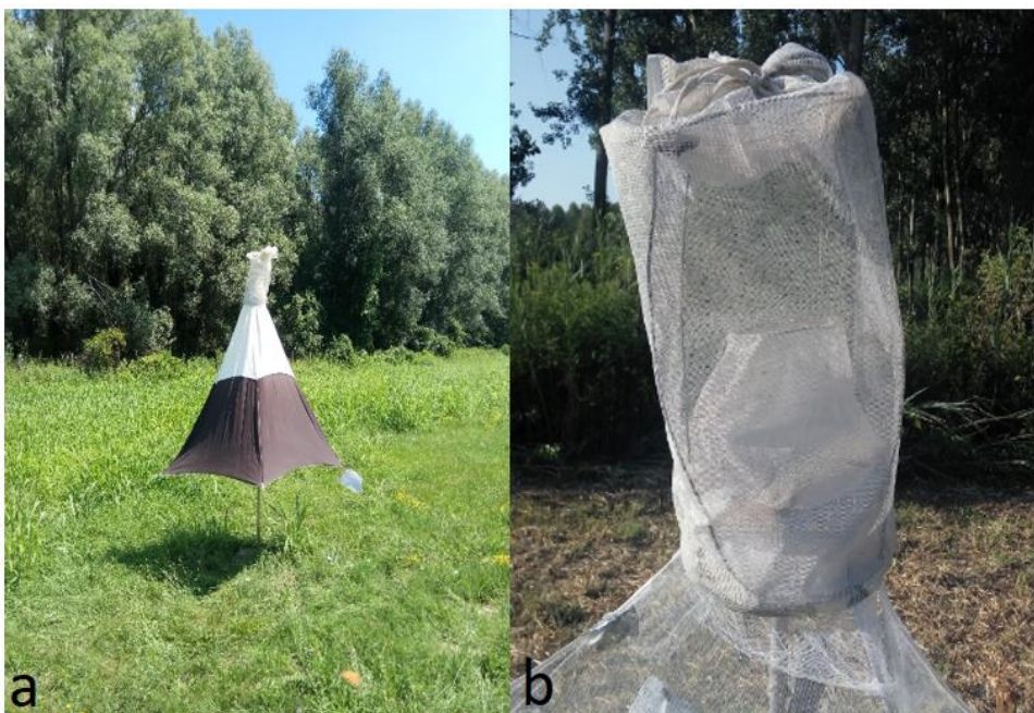
b) Manitoba klopka (tzv. canopy trap) (oznaka a = klopka; oznaka b = sakupljačka kapa klopke)