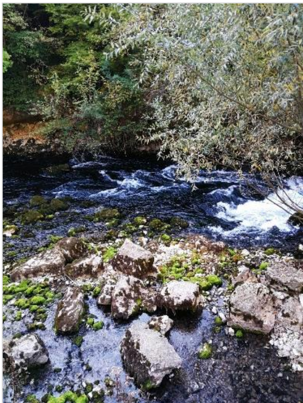
Izvorišno područje Rude (uzorkovano područje)