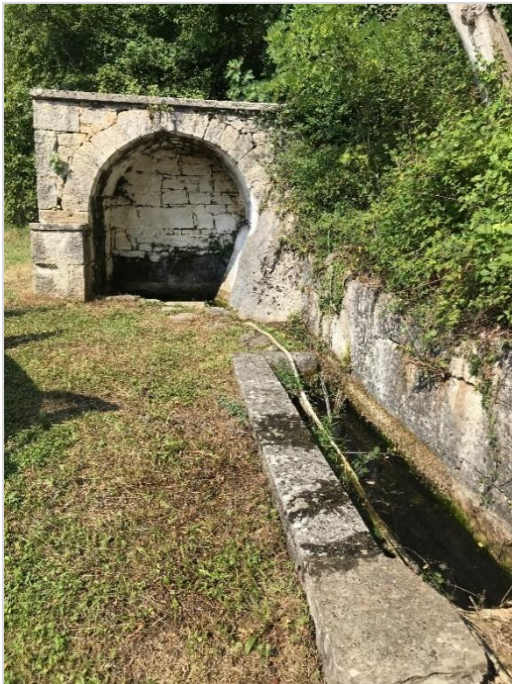
Izvor sv. Bartol (kraj Motovuna), kameni izvor