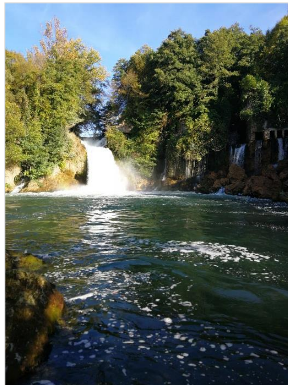
Bilušića buk (Krka) (uzorkovano područje)