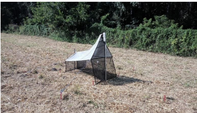
a) Malezova klopka