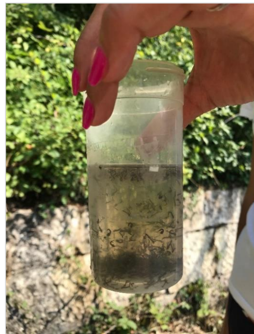
Izvor sv. Bartol (kraj Motovuna), kameni izvor