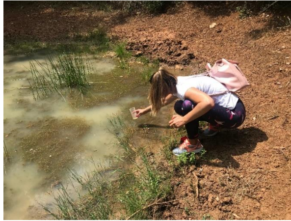
Lokva st. Bečić – 26.7.2019., sakupljanje ličinki