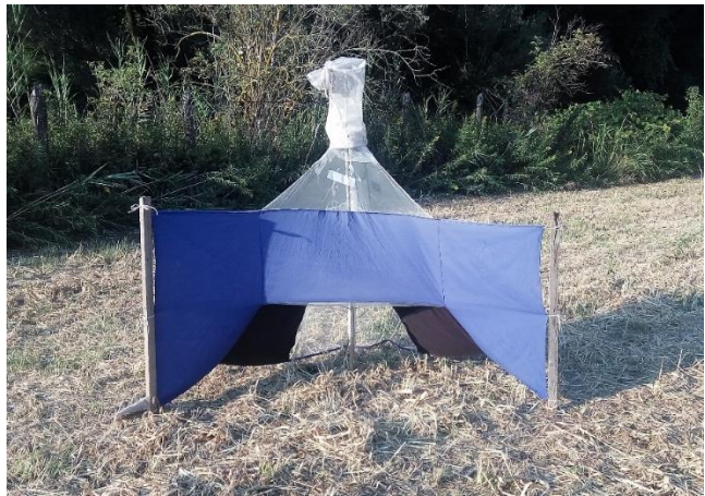
b) Nzi klopka.