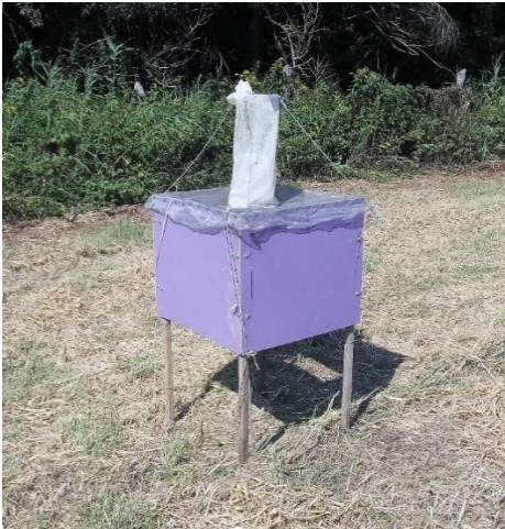
a) Modificirana kutija klopka